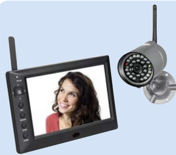
DF270 Set Art.Nr. 27 275