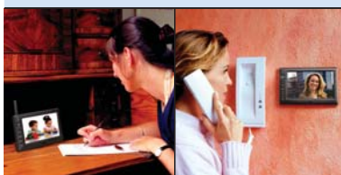
Monitor zum Aufstellen, Aufhängen oder für tragbaren Betrieb